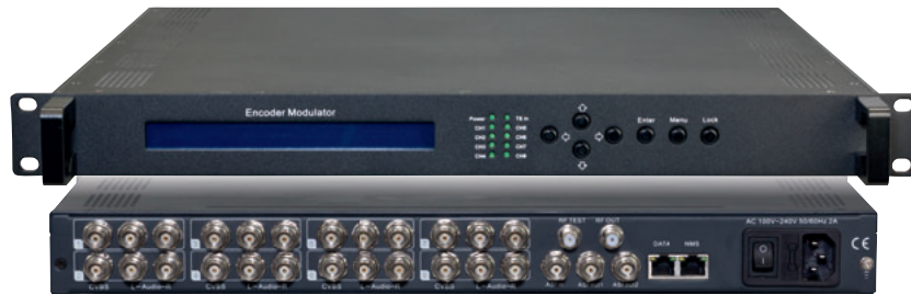
Vorderseite / Front