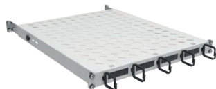
Geräteboden ISU/1U - fest, mit Kabeldurchlässen und Kabelführungsbügel